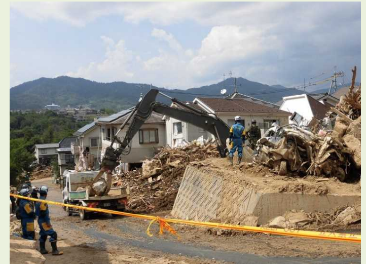
③ 損壊した家屋等の解体、 がれきの収集・運搬及び処分