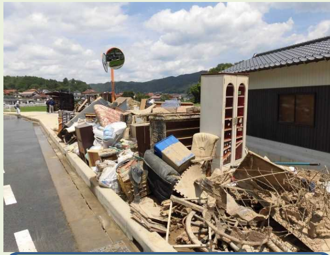
② 片付けごみの 収集・運搬及び処分